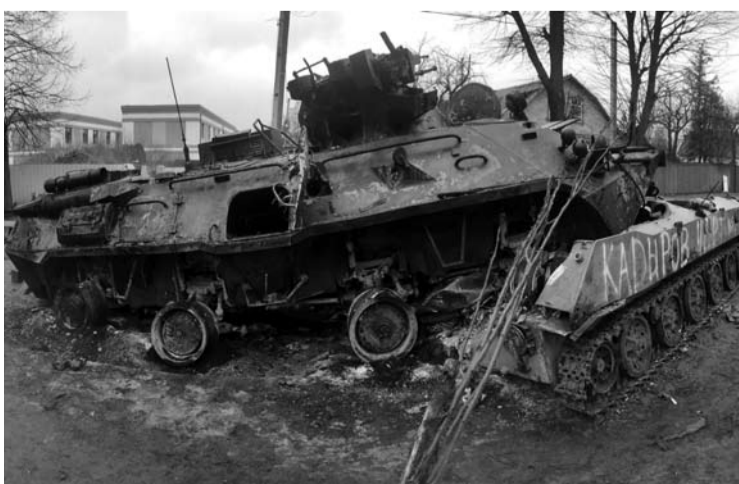
Daliai okupantų įsiveržimas į Irpinę baigėsi mirtimi.