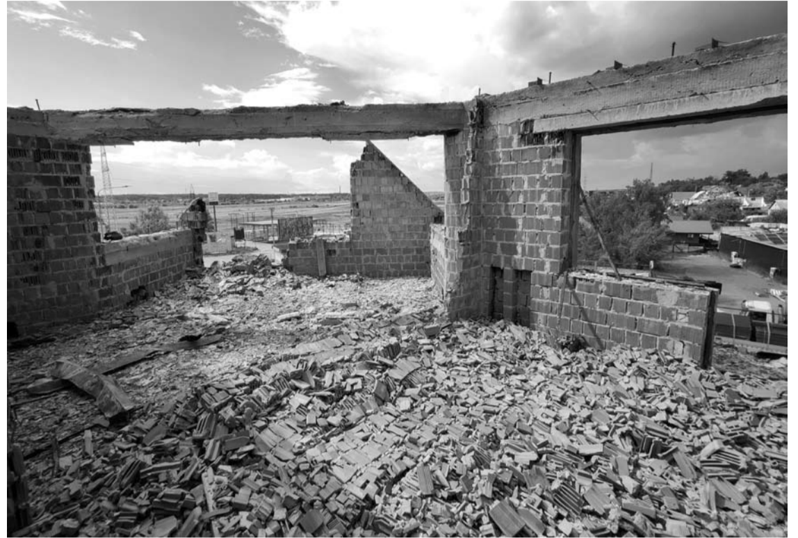
Maskoliai, sugriovę daugybę Irpinės statinių, sukėlė didžiulį skausmą gyventojams.