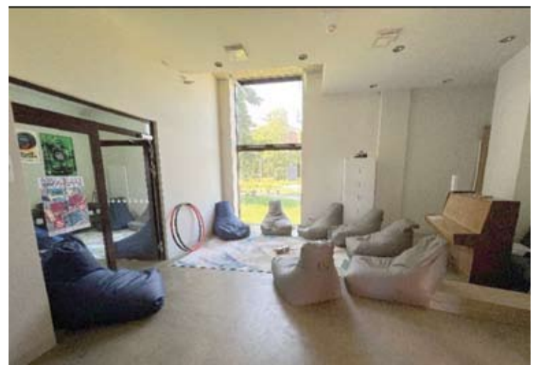
Šiais metais Anykščių rajono savivaldybės L. ir S. Didžiulių bibliotekos patalpose įsikūrė atviras jaunimo centras.