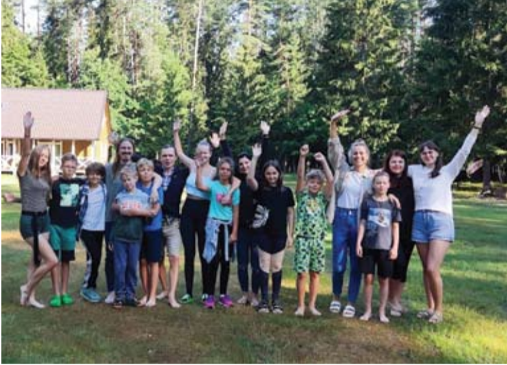
Anykščių jaunimo klubas organizuoja vaikams stovyklas, kurių tikslas – buvimas gamtoje, išgyvenimas joje, praktinis mokymasis.